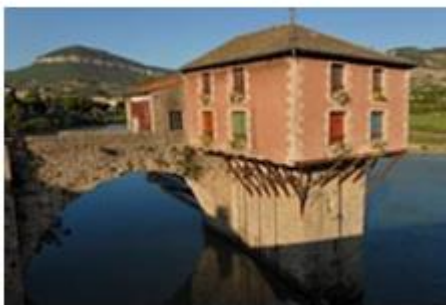
Le pont vieux