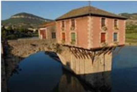
Le pont vieux