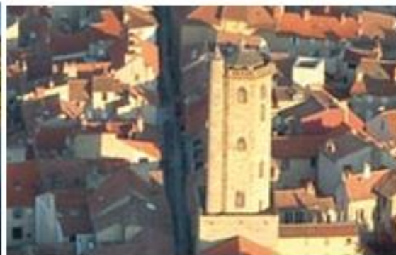
la tour carrée